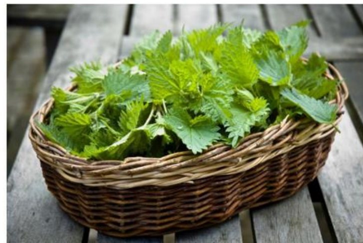
KOPRIVA – kraljica divjih zdravilnih rastlin