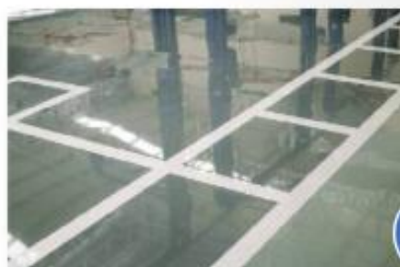
Tla iz epoksidne smole