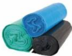
Vrečke za smeti iz LDPE-ja