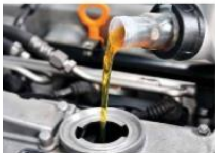
Motorno olje dodajamo za mazanje gibljivih delov v motorju.

Silikonska olja uporabljamo predvsem kot mazivo in kot hidravlično olje pri delovnih strojih in pri zavorah na avtomobilih.