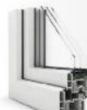
Okenski okvir iz trdega PVC-ja