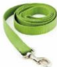
Povodec za psa iz perlona