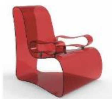
Estetsko oblikovan stol iz akrilnega stekla