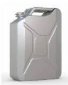
Ročka za rezervno gorivo iz polietilena visoke gostote, ki je odporen proti kemikalijam

Estetske lastnosti so zelo pomembne zaradi prvega vtisa, ki ga dobimo ob pogledu na izdelek iz umetne snovi. Pomembni so predvsem barva, sijaj in gladka ali hrapava površina. Izdelki iz umetnih snovi so najrazličnejših barv.