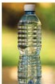
Plastenka iz PETE-ja