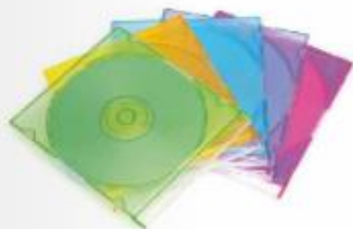
Škatlice za CD-je iz trdega polistirena