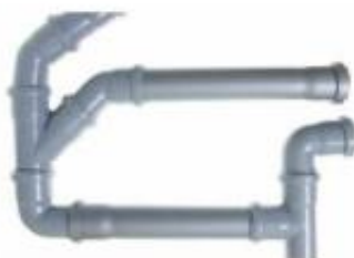
Odtočne cevi iz juvidurja