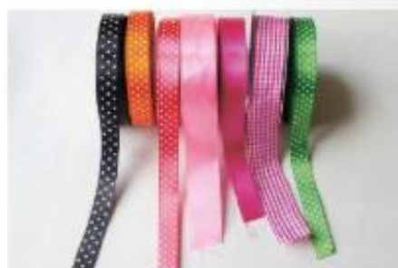
Dekoratívni trak iz poliestra.

Epoksidne smole so trde in se uporabljajo v kombinaciji z različnimi vlakni, tako kot poliestrske smole.