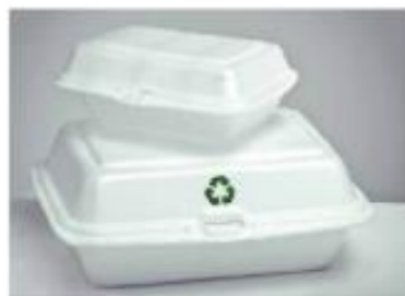
Posoda iz penjenega polistirena