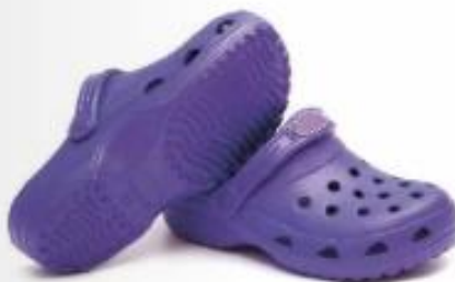
Natikači, tatami preproga iz etilen vinil acetata