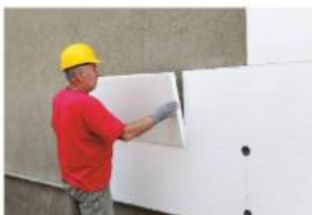
Zunanje stene hiše obložimo s ploščami iz stiropora, da zmanjšamo toplotne izgube. So tudi izolator zvoka.