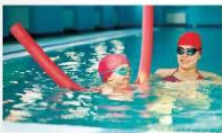
Penasti »črv« iz polietilena je odličen pripomoček za učenje plavanja.

Fizikalne lastnosti umetnih snovi so gostota, električna in toplotna prevodnost, tališče, vrelišče, magnetne lastnosti, specifična toplota, viskoznost in temperaturni razteznostni koeficient . Umetne snovi imajo majhno gostoto, nekatere so tudi lažje od vode (npr. stiropor). So dobri izolatorji toplote in električnega toka, nekatere tudi zvoka.