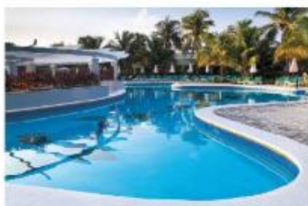
Poliestrški bazeni so izdelani iz poliestrske smole in steklenih vlaken, nanosenih na posebej izdelane kalupe.