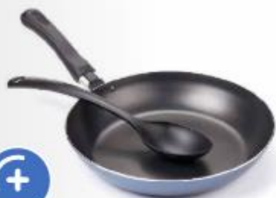
Ročaj ponve in žlica iz bakelita