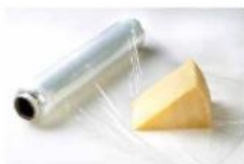
Folije iz mehkega PVC-ja