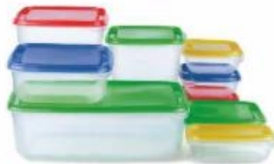
Gospodinska posoda za shranjevanje iz polipropilena