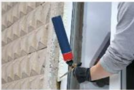
Nanašanje poliuretanske pene (purpena)