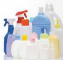
Plastenke za čistila iz HDPE-ja

Neobarvan polivinilklorid (PVC) je rumenkasto prosojen. Odporen je proti nekaterim kemikalijam, ne pa tudi proti višjim temperaturam. Poznamo trdi in mehki PVC.