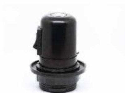
Bakelitni okov žarnice

Aminoplasti so velika skupina umetnih smol. Te s stiskanjem predelujejo v različne izdelke, ki imajo gladke površine in so odporni proti sončnim žarkom. Smole so uporabne tudi kot veziva in surovina za lepila.