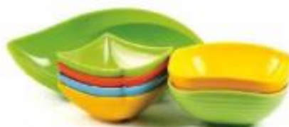
Posoda iz melamina