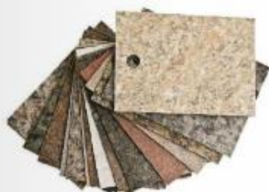
Umetni furnir, ki daje videz kamna, iz aminoplasta