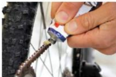
Mazanje verige s silikonsko mastjo

Silikonsko mast dobijo tako, da pomešajo silikonsko olje s snovjo za zgoščevanje. V vsakdanjem besednjaku največkrat uporabljamo besedo vazelin. Preprečuje korozijo. Uporabljamo jo predvsem za mazanje strojnih delov (zobniki, ležaji, tečaji na vratih itd.).