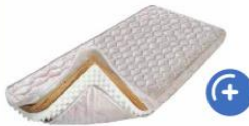
Ležišče s poliuretansko peno

Etilen vinil acetat je vzdržljiv pri nizkih temperaturah, odporen proti UV-sevanju in ima vodotesne lastnosti.