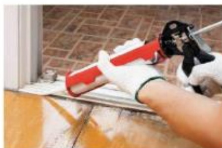
Silikonski kit za tesnjenje oken

Silikonska guma (silikonski kit) je v neutrjenem stanju zelo lepljiv gel in jo navadno nanašamo z brizganjem. V trdnem agregatnem stanju pa je izredno prožna. Uporablja se za tesnila, električno izolacijo, cevke za transfuzijo itd.