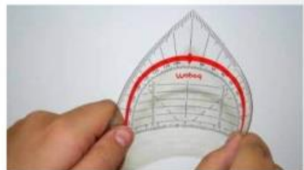
Upogljiv geotrikotnik iz prožne umetne snovi