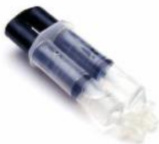
Epoksidno (dvokomponentno) lepilo