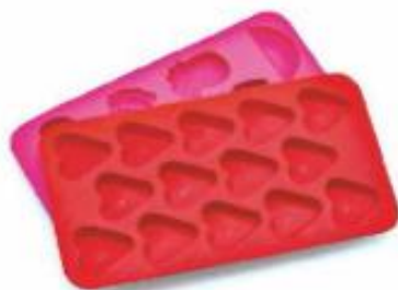
Modelčki za pečenje peciva iz silikonske gume

Silikonske smole so zelo odporne proti visoki temperaturi. Uporabljajo jih za izdelavo izolirnih lakov ter kot premaze v pečeh, dimnikih in na stenah.